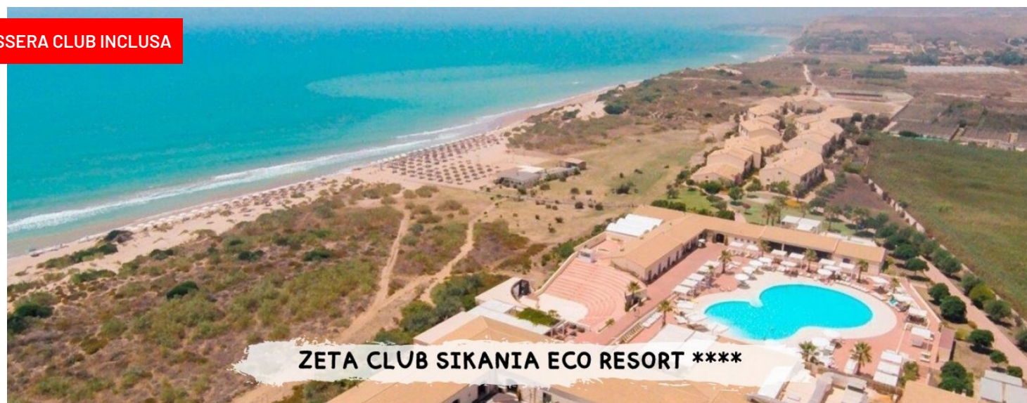
ZETA CLUB SIKANIA ECO RESORT ****