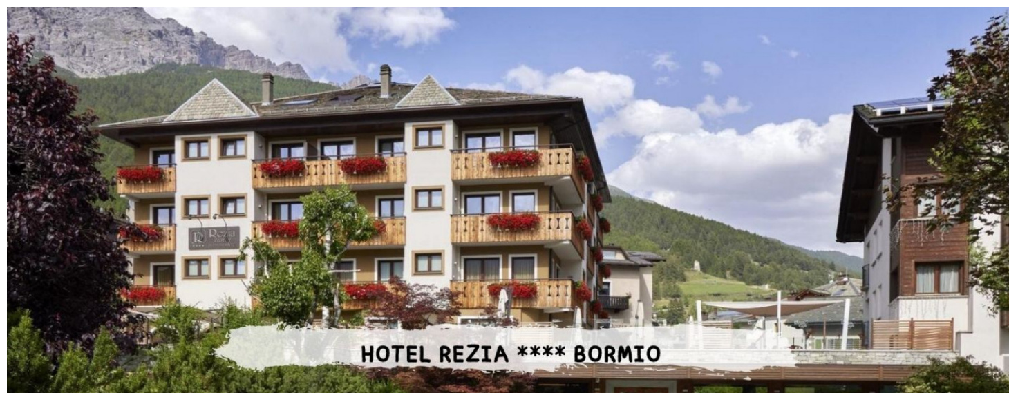
HOTEL REZIA **** BORMIO