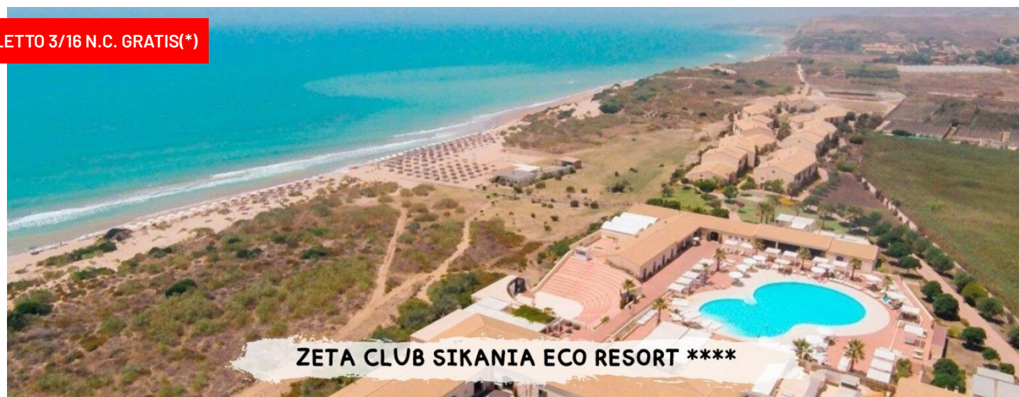
ZETA CLUB SIKANIA ECO RESORT ****