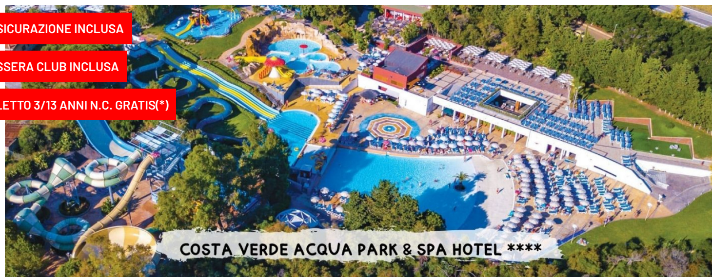
COSTA VERDE ACQUA PARK & SPA HOTEL ****