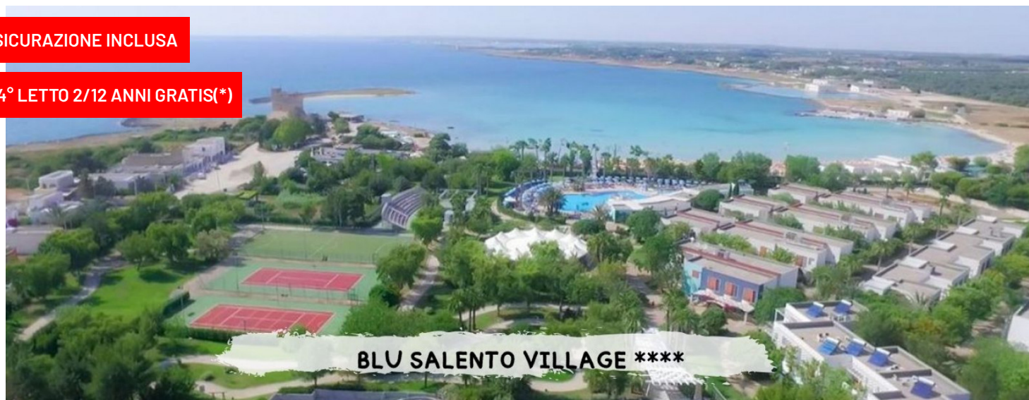
BLU SALENTO VILLAGE *****