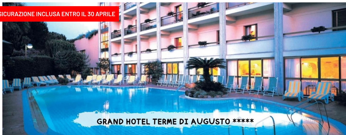
GRAND HOTEL TERME DI AUGUSTO *****

ASSICURAZIONE INCLUSA ENTRO IL 30 APRILE