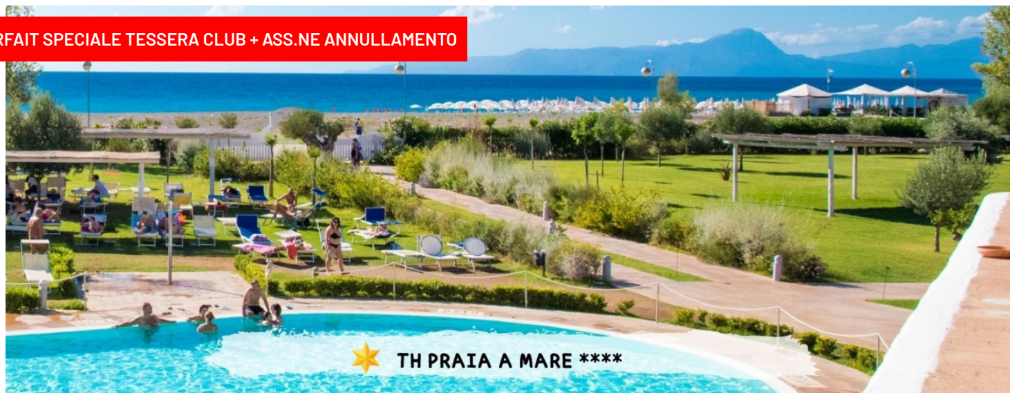
Quote settimanali a persona per periodo con trattamento di All inclusive

FORFAIT SPECIALE TESSERA CLUB + ASS.NE ANNULLAMENTO