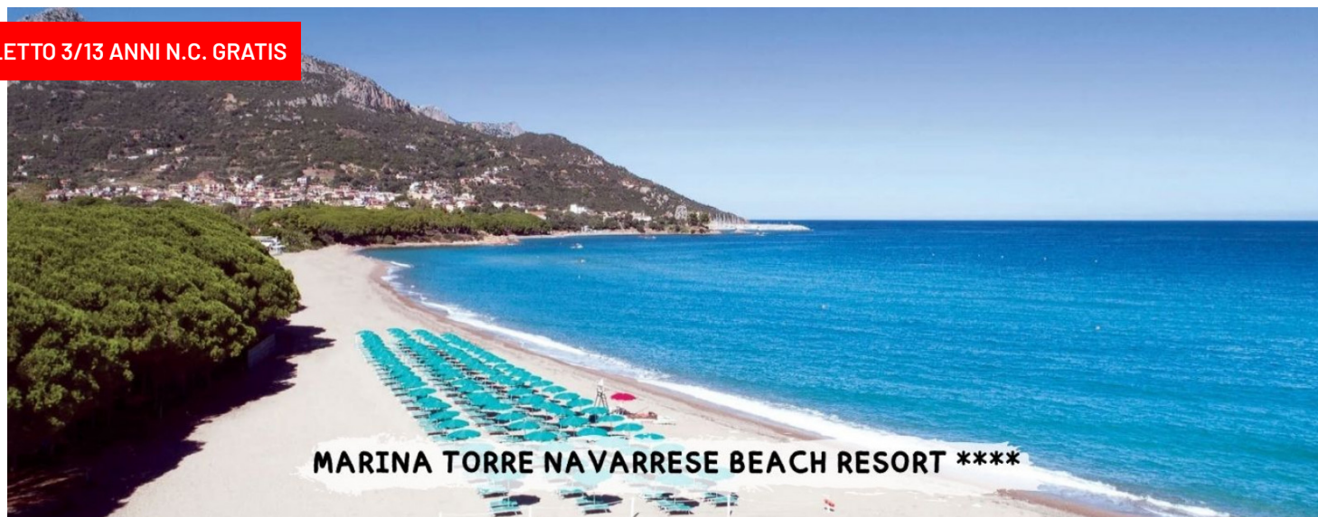
MARINA TORRE NAVARRESE BEACH RESORT ****