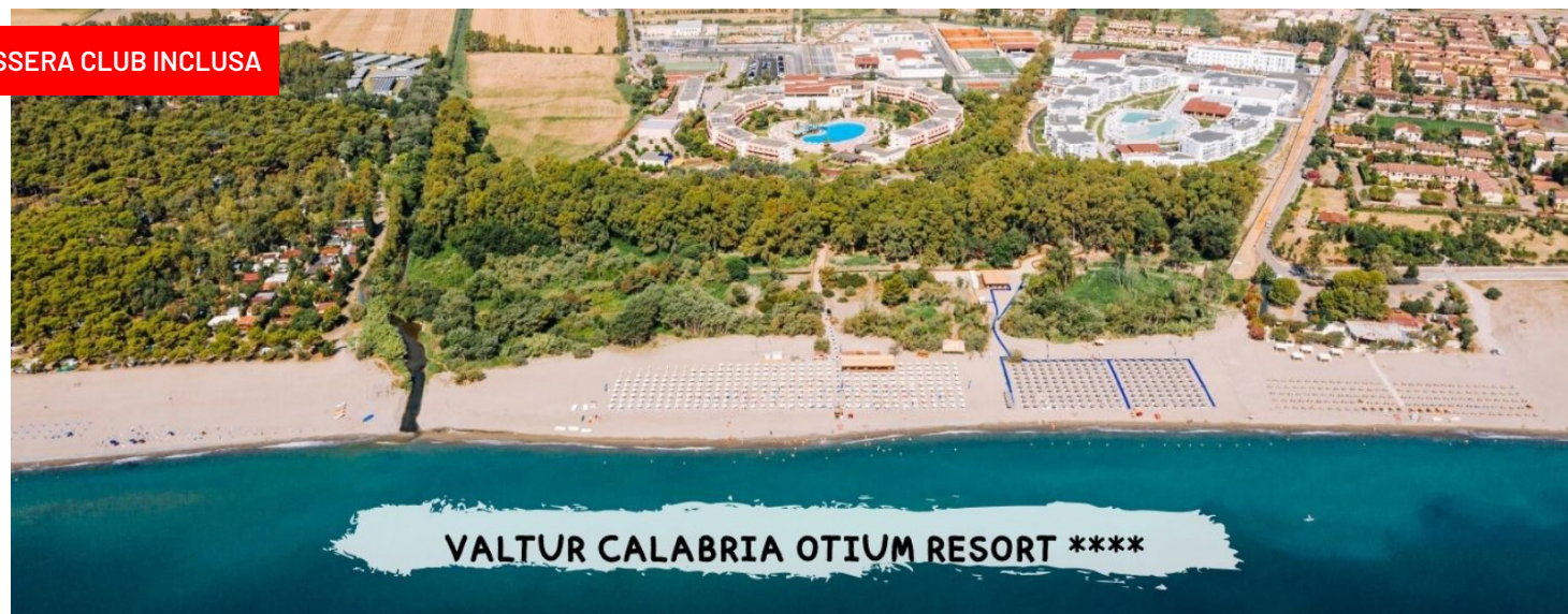
VALTUR CALABRIA OTIUM RESORT *****

quota a partire da a persona in camera doppia trattamento all inclusive