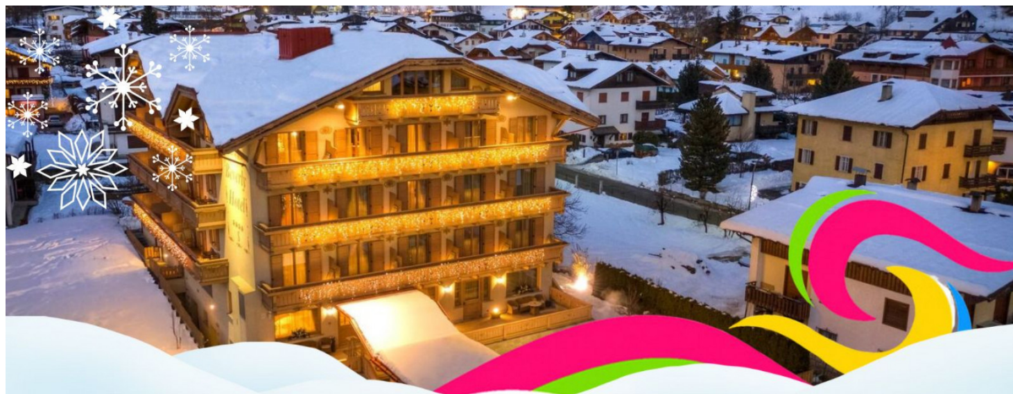
Tariffa per persona al giorno in camera e colazione - Tariffa netta valida dal 01/11/25