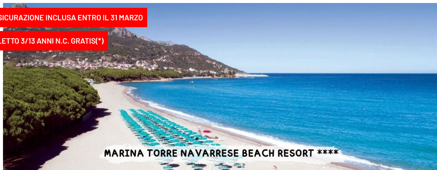
MARINA TORRE NAVARRESE BEACH RESORT ****