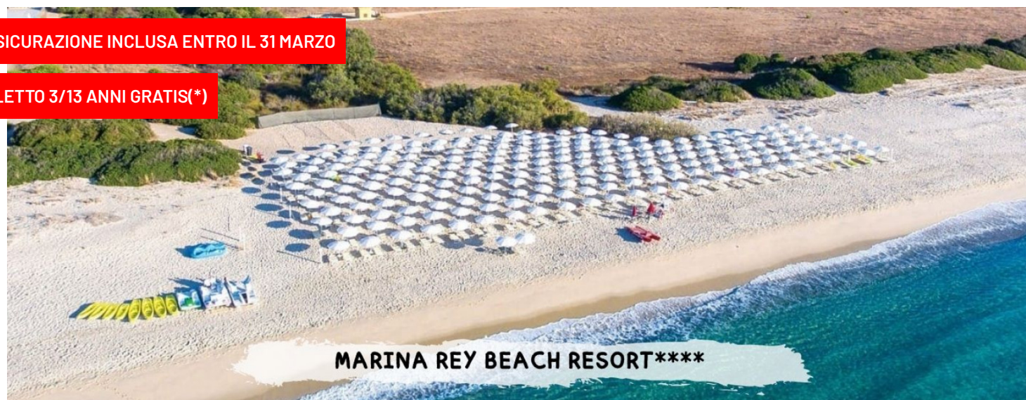
MARINA REY BEACH RESORT****