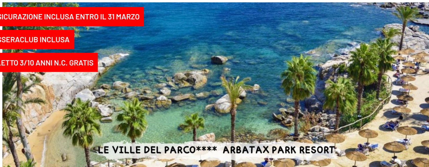
LE VILLE DEL PARCO**** ARBATAX PARK RESORT

sistemazione "le ville del parco" - camera standard pensione completa - bevande incluse - tessera club inclusa pacchetti con nave + auto o in solo soggiorno -7/10/11 notti