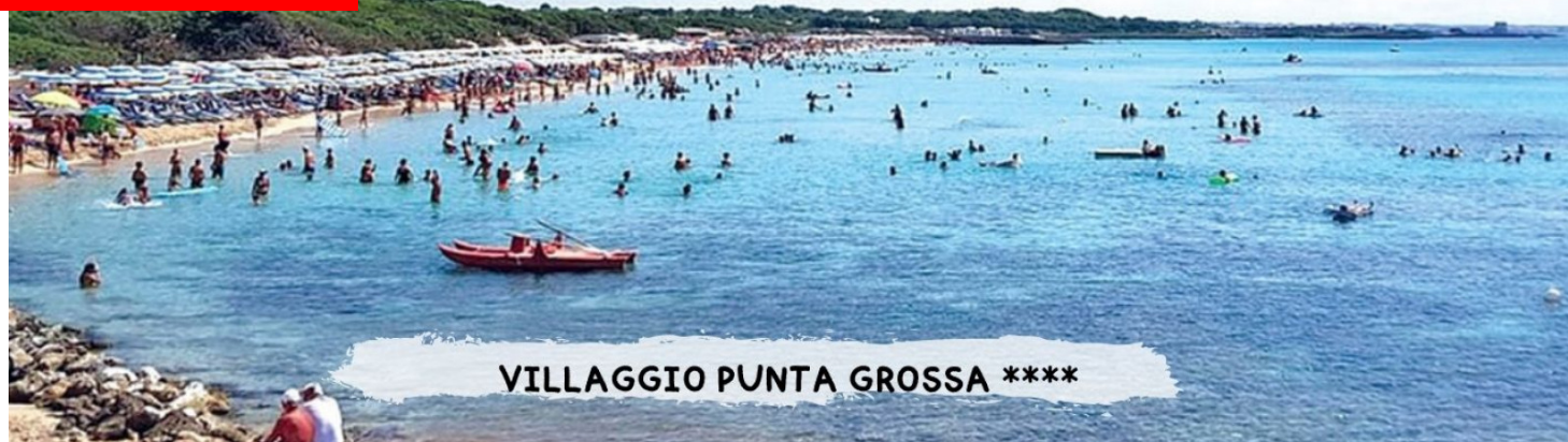
VILLAGGIO PUNTA GROSSA ****