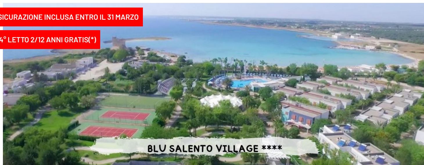
BLU SALENTO VILLAGE ****