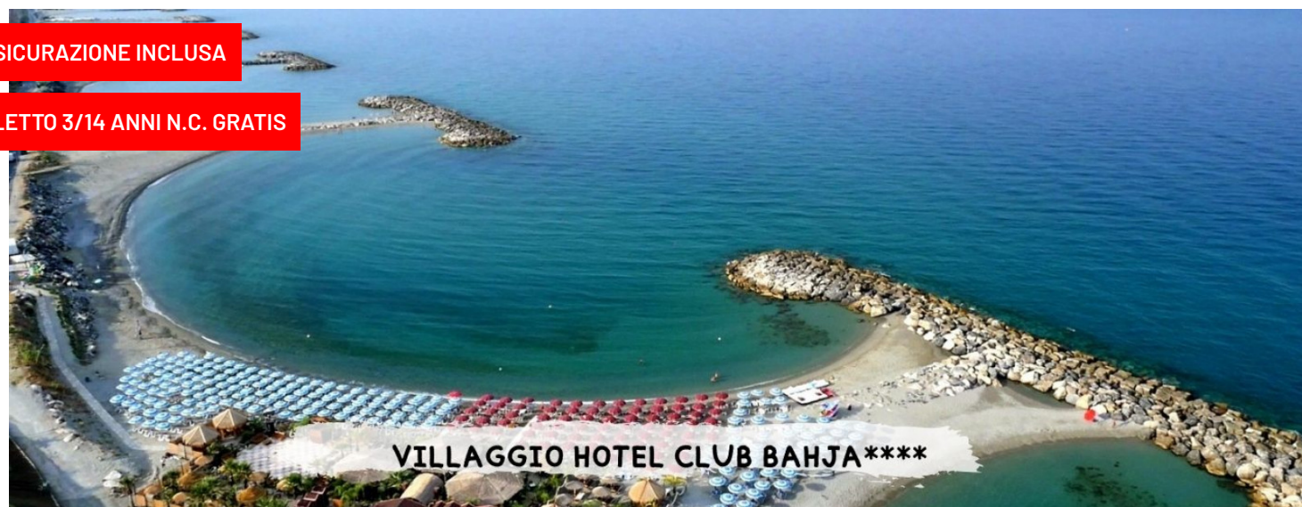
VILLAGGIO HOTEL CLUB BAHJA****