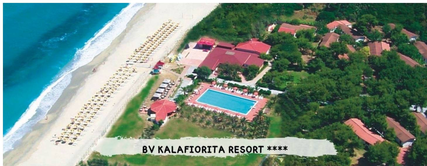
BV KALAFIORITA RESORT ****