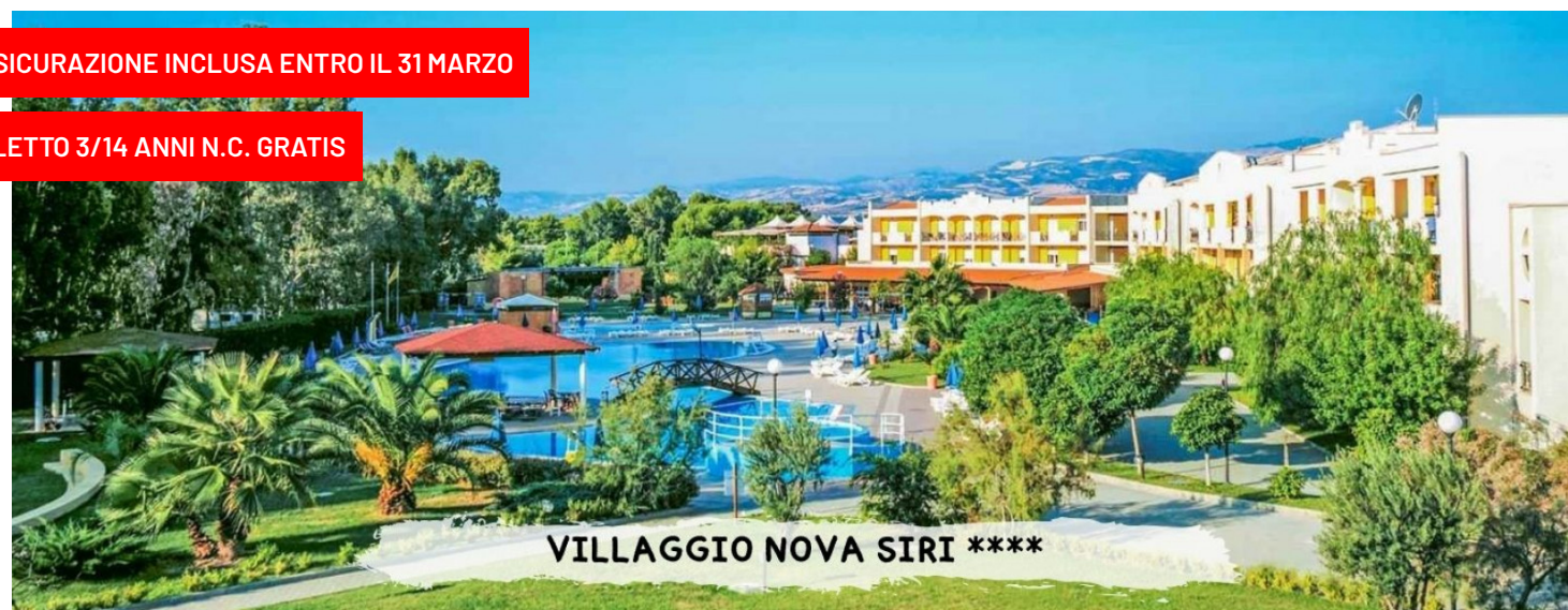
VILLAGGIO NOVA SIRI ****