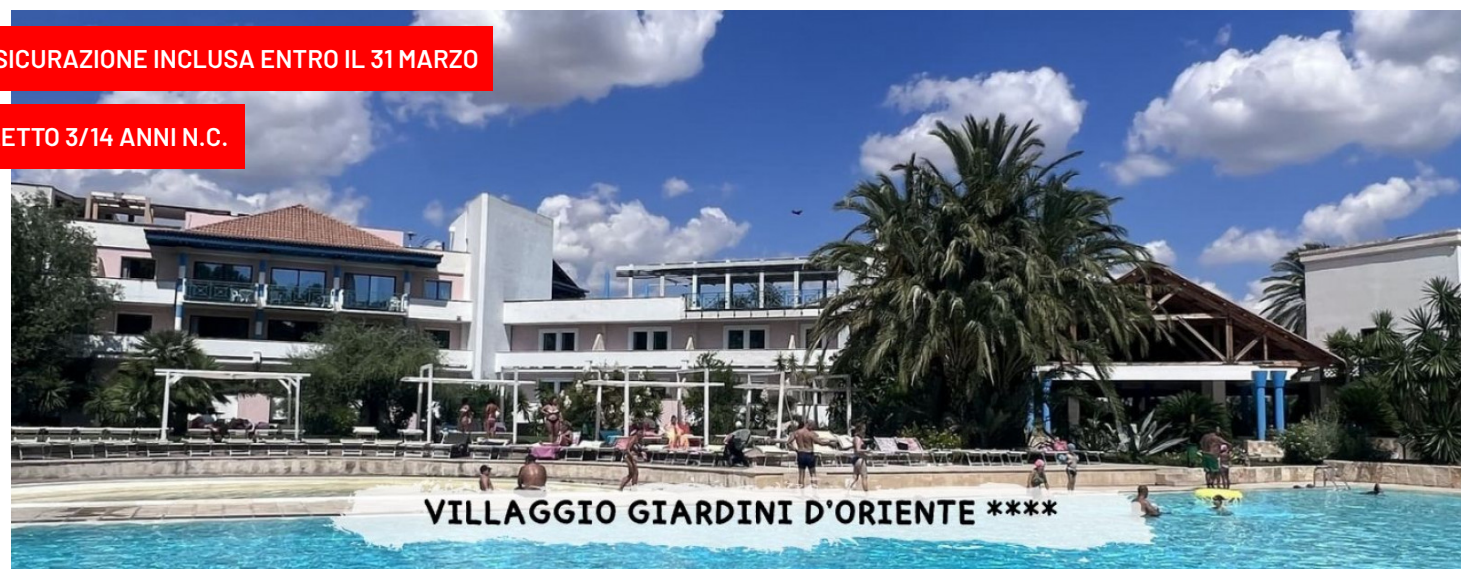
VILLAGGIO GIARDINI D'ORIENTE ****