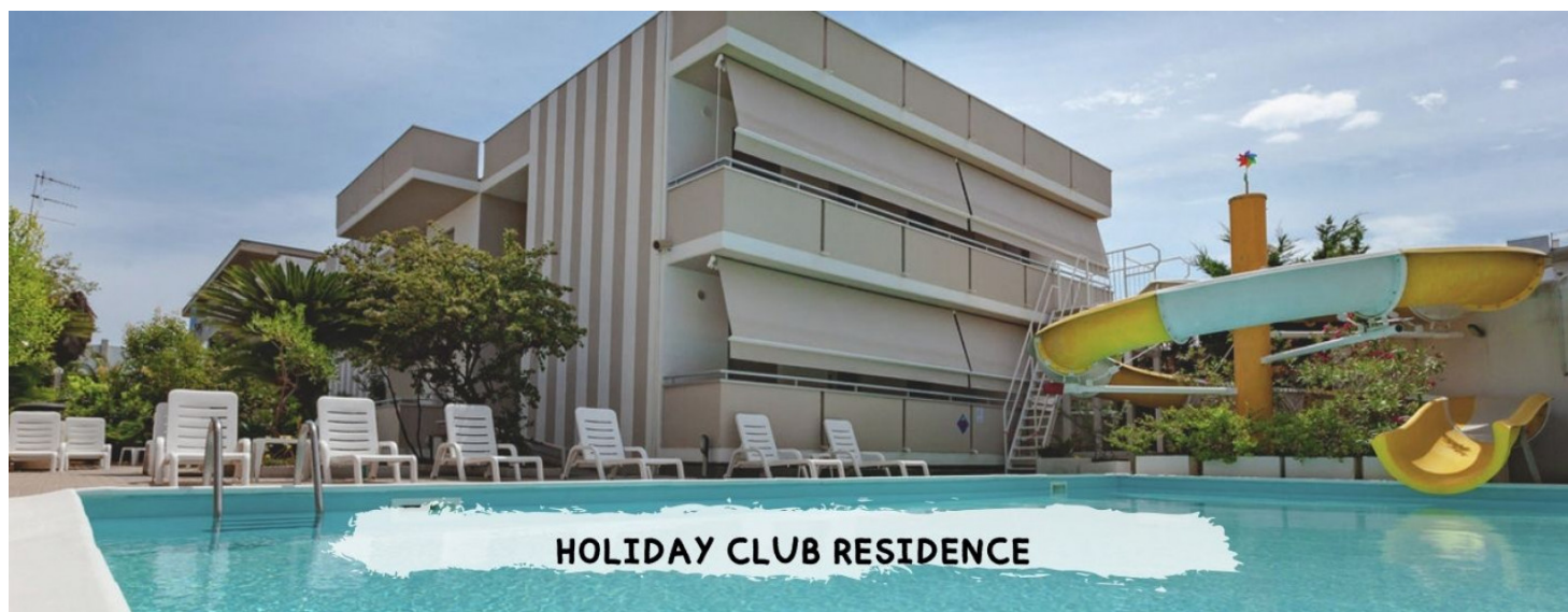
HOLIDAY CLUB RESIDENCE